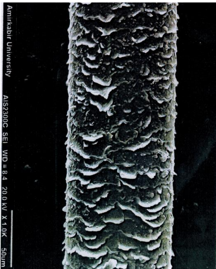
قبل از استفاده