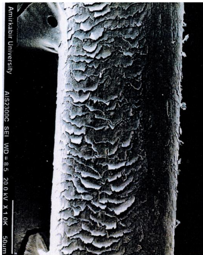
یک ماه پس از مصرف